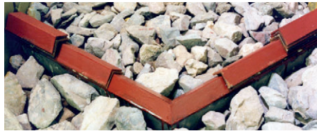
Speziell geformte Sohlschwelen in der Bootsgasse

Im Ergebnis findet der geübte Wassersportler heute eine großzügig gestaltete Bootsgasse aus örtlich anstehendem Ruhrsandstein vor. Diese wurde in Modellversuchen an der Universität Karlsruhe so konzipiert, dass sie für Ruderboote (bis Vierer) und Kanus genutzt werden kann.